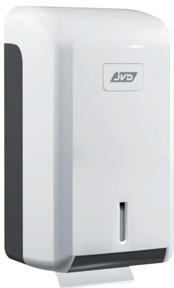
8 99 607