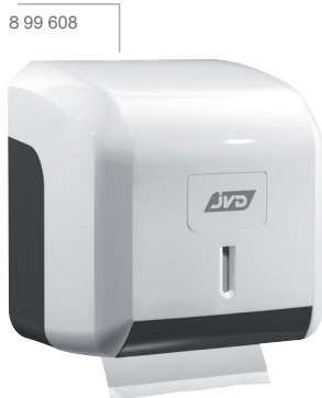
8 99 608