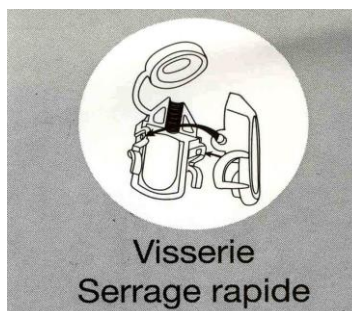
Visserie Serrage rapide