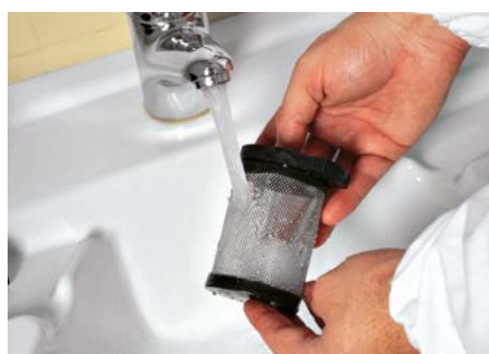
Vispa 35 E-B-BS Nettoyage total, simple et pratique du filtre d'aspiration