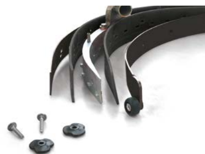
Vispa 35 E-B-BS Pour obtenir un bon séchage, les bavettes du suceur doivent toujours être propres. En cas d'usure, leur remplacement est très simple