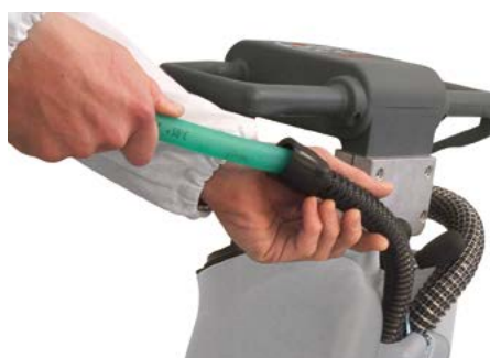
Vispa 35 B-BS Nettoyage périodique du flexible d'aspiration pour garantir une aspiration efficace