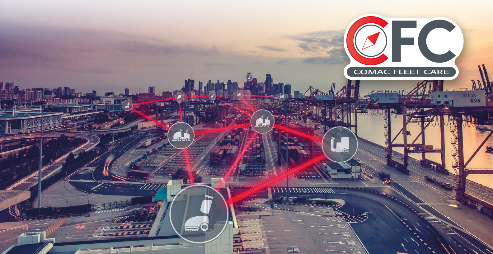
LES TECHNOLOGIES DE VISPA XL